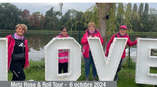
Metz Rose & Roll Tour - 6 octobre 2024