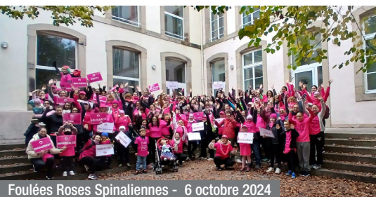
Foulées Roses Spinaliennes - 6 octobre 2024

Vous souhaitez en savoir plus en matière de prévention santé, rendez-vous sur lorraine.msa.fr