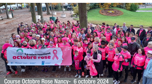
Course Octobre Rose Nancy- 6 octobre 2024